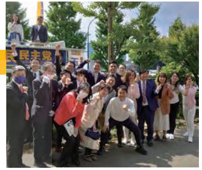
代々木公園・中央メーデー会場での街頭演説会にて